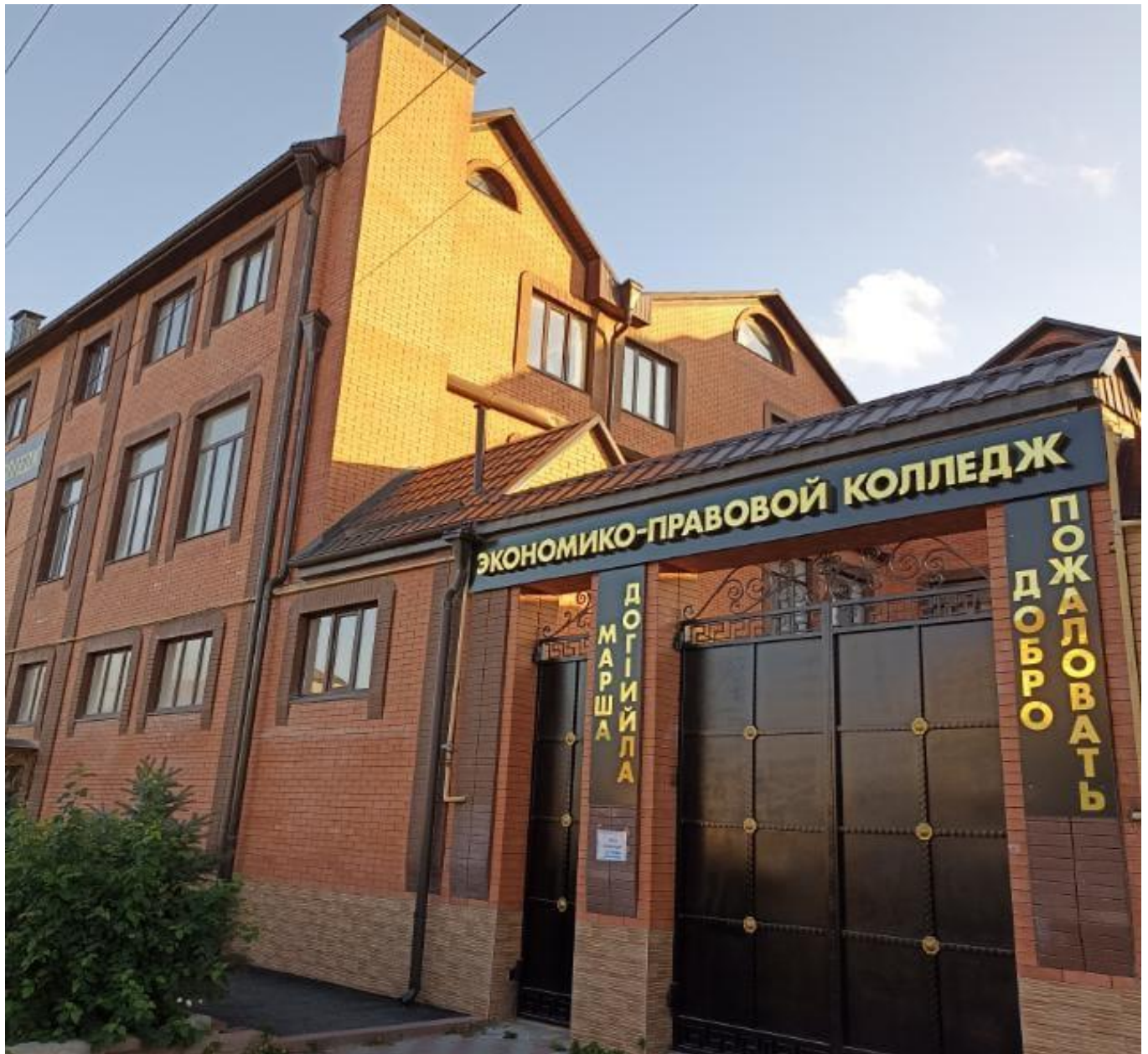
Рисунок 1. ЧУПО «Экономико – правовой колледж»

Колледж в своей деятельности руководствуется Конституцией Российской Федерации, международными договорами Российской Федерации, федеральными конституционными законами, федеральным законом «Об образовании в Российской Федерации», Федеральным законом «Об автономных учреждениях», иными нормативными правовыми актами Российской